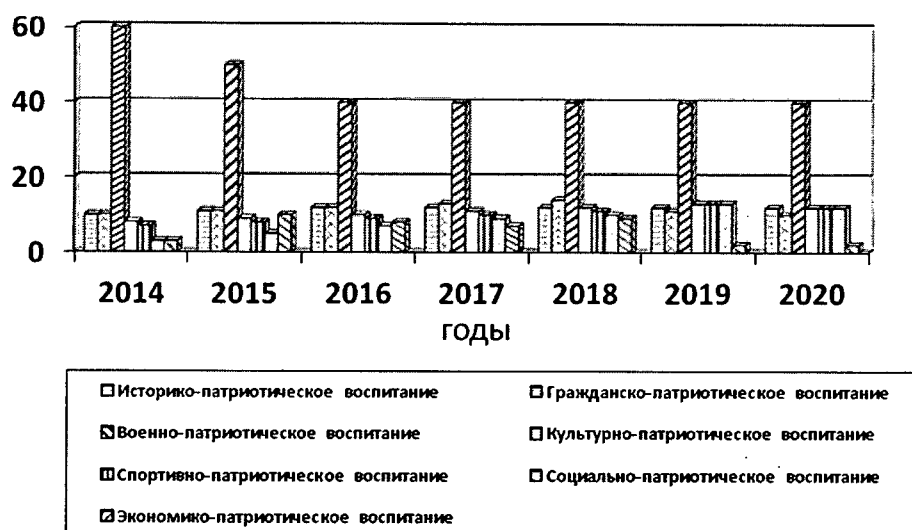
Рисунок 1. Доля мероприятий по каждому из направлений к общему количеству мероприятий по первому сценарию развития