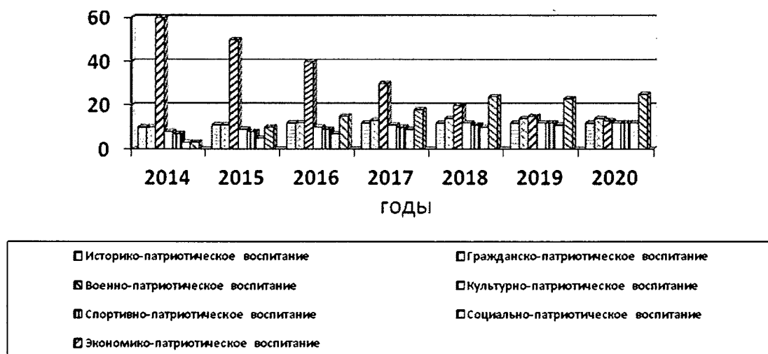
Рисунок 2. Доля мероприятий по каждому из направлений к общему количеству мероприятий по второму (базовому) сценарию развития

Сценарий предполагает также развитие в той или иной мере всех других направлений патриотического воспитания, обозначенных в разделе 3 (рисунок 2).